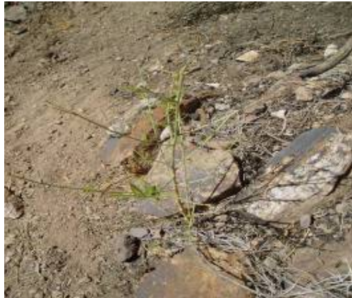
Imagen 3. Plántulas de escobón afectadas por ramoneo.

Por otro lado, el sotobosque juega un papel fundamental para el pinzón azul de Gran Canaria ya que le permite protegerse de sus predadores, así como proporciona un lugar de alimentación. La eliminación del mismo por efecto del fuego hace que los individuos se encuentren desprotegidos ante los predadores cuando se acercan a beber a los puntos de agua o se alimentan. Al ralentizarse los procesos de recuperación del sotobosque se aumenta el tiempo de desprotección de los pinzones, hecho que unido al efecto que tuvo el fuego sobre sus poblaciones, dificultan su recuperación.