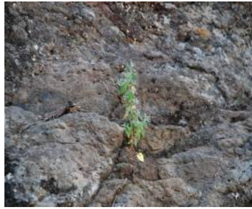
Imagen 7. Plántulas del turmero peludo ( Helianthemum bystropogophyllum ) que han sobrevivido al ramoneo de las cabras gracias a los vallados.

Por otro lado, se ha realizado un seguimiento de las poblaciones, tanto de la recuperación de los individuos adultos después del fuego como de la regeneración natural de las mismas. Se ha realizado el seguimiento de las poblaciones de la jarilla de Inagua ( Helianthemum inaguae ), el turmero peludo ( Helianthemum bystropogophyllum ), la cresta de gallo ( Isoplexis isabeliana ), el rosalillo ( Dendriopoterium pulidoi ), la siempreviva de Amargo ( Limonium sventenii ), la retama ( Teline rosmarinifolia rosmarinifolia ), la bella de risco ( Scrophularia calliantha ), la salvia ( Sideritis sventenii ), Crambe scoparia , y Limonium vigaroense , constatándose una recuperación óptima de las mismas (incluso se han mejorado los datos previos al efecto del fuego, como es en el caso de la jarilla de Inagua y la cresta de gallo).