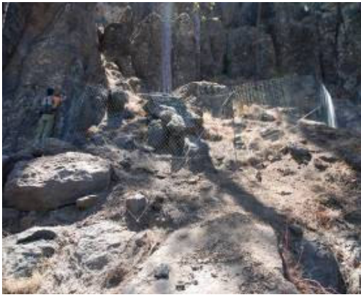
Imagen 6. Vista general de uno de los vallados ya instalados.