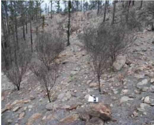
Imagen 2. Efecto del fuego en el sotobosque (año 2009).

actualmente una regeneración del mismo desde el banco de semillas o por rebrote. Al pasar un periodo con poco material vegetal que consumir, las cabras han ejercido todo su ramoneo sobre esta regeneración, disminuyendo el éxito de la misma. Esto hace que se ralenticen los procesos de recuperación del mismo, por lo que se aumenta el tiempo de exposición de los suelos al efecto de los procesos erosivos, como es la escorrentía, donde el sotobosque juega un papel fundamental en su minimización.