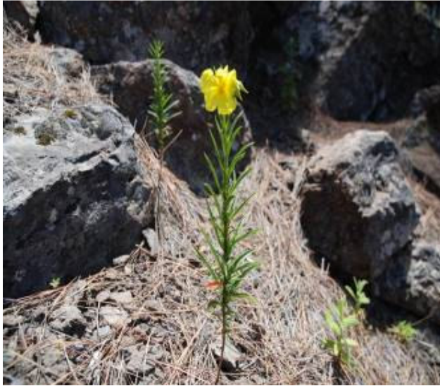
Imagen 1. Plántulas de la jarilla de Inagua ( Helianthemum inaguae ) naciendo fuera de los refugios conocidos antes del incendio. Las mismas han sobrevivido a la presión de las cabras gracias a los vallados de protección llevados a cabo en el ámbito del proyecto LIFE+ Inagua.

realizan desde el Gobierno de Canarias y el Cabildo de Gran Canaria. No obstante los núcleos de población no han podido aumentar su área de distribución debido al ramoneo constante y pisoteo del ganado, hecho que hace que las poblaciones sigan estando recluidas en zonas inaccesibles.