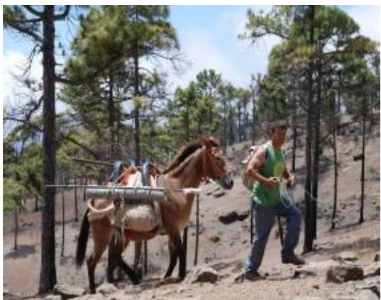
Imagen 4. Transporte de materiales con animales de carga.

Se está actuando sobre las poblaciones más afectadas por el ganado y cuya situación es preocupante, en concreto esta acción ha afectado a las poblaciones de la jarilla de Inagua ( Helianthemum inaguae ), el turmero peludo ( Helianthemum bystropogophyllum ), la cresta de gallo ( Isoplexis isabeliana ), la siempreviva de Amargo ( Limonium sventenii ) y la retama ( Teline rosmarinifolia rosmarinifolia ). Se ha procedido a vallar las poblaciones con el fin de proteger la regeneración natural que se detecta en las mismas desde el banco de semillas. Con ello ya se ha detectado el éxito de supervivencia de individuos nacidos en la presente anualidad, con lo que se espera que en los próximos años se aumente de forma significativa las poblaciones de dichas especies.