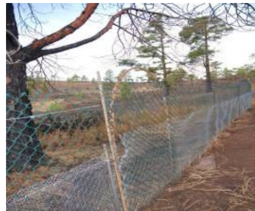
Imagen 9. Detalle del vallado donde se puede observar dos tipos de malla para evitar el acceso de los conejos.