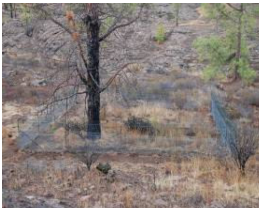
Imagen 8. Vista general de uno de los vallados de exclusión.

Se está desarrollando un estudio del impacto de los herbívoros introducidos en el ámbito de la Reserva Natural Integral de Inagua cuyo fin es obtener datos cuantitativos y cualitativos de la afección de los mismos sobre el hábitat. Para ello se ha instalado una red de parcelas de exclusión (parcelas de 10x10 valladas para evitar la entrada de cabras y conejos) y de control (situadas en las proximidades de las parcelas de exclusión).