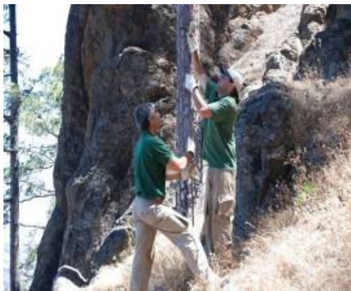
Imagen 5. Trabajando en los vallados.